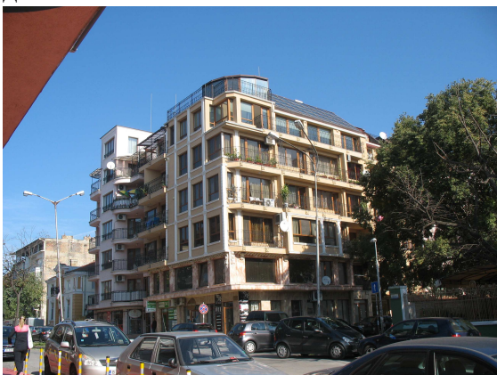
Фиг. 20. Апартаментна сграда на ъгъла на бул. Сливница / ул. Цар Асен , 2012

Нова сграда на бул. Сливница с апартаменти и обществено обслужване, несъобразена с мащаба на съседната характерна застрейка, но декорирана с еkleктични псевдо-стилни детайли.