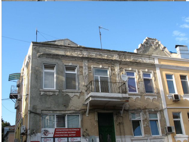
Фиг. 14-15. Оригиналната фасадна пластика е без аналог във Варна

Намесата в оригиналната архитектура започва по-рано, около 2000-та година, когато е направена реконструкция на двата симетрични балкона, поради амортизиране на конзолните дървени греди, които ги носят.