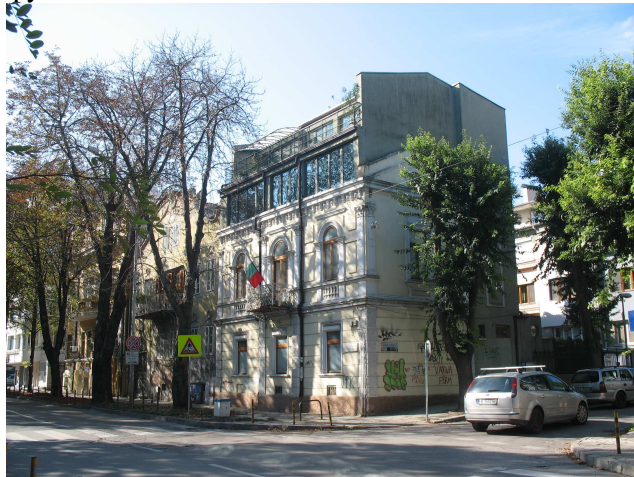
Фиг. 28. Сграда на ъгъла на бул. Приморски / ул. Княз Батенберг

включително обемна. Това позволява съхраняване на оригиналната архитектурно-строителна структура, фасадната и стилова характеристика на паметниците и осигурява адаптирането им за многообразни съвременни функции.