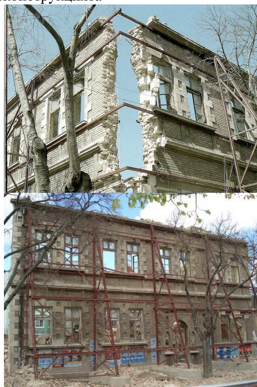
Фиг.6-7. Етапи на програмираното саморазрушаване

Случайното самосрутване на ъгъла на монолитната фасадна структура е достатъчното условие за дестабилизиране