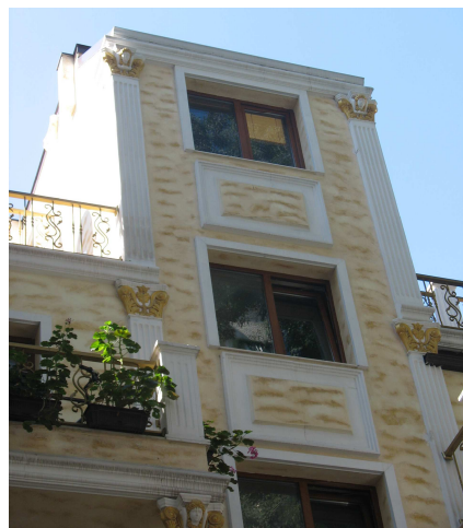
Фиг. 27. Фасадни фрагменти от същата сграда

Интересно е да се разбере логиката на подобен прецедент, на фона на цитираните по-горе практики за подмяна на автентично архитектурно наследство със регистрирани неостилови характеристики.