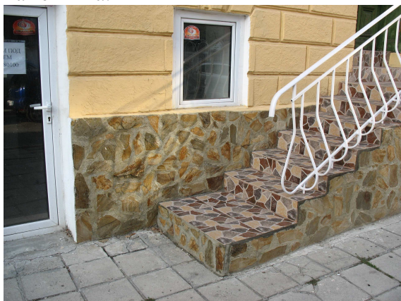
Фиг. 20. Подменени са оригиналните с чужди на паметника материали

Несъответствието между оригинала и реновираните елементи се подчертава от различното фасадно оцветяване, според предпочитанията на отделния собственик, въпреки че се касае за общата визия на паметника.