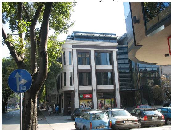
Фиг. 3. Новата сградата/ ъгъла на бул. Мария Луиза и ул. 27 юли .

Първият метод - подмяна поради амортизиране е приложен в сграда, реализирана в център на Варна (Фиг. 3). Съвременната визия и още по-малко използваните материалите, чужди на архитектурата от началото на 20 век, по никакъв начин не биха се разчели като възстановка на оригиналната архитектура, както се опитват да ни убедят нейните автори.