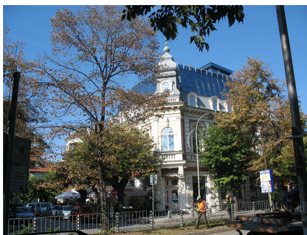
Фиг. 30. Сграда на ъгъла на ул. Шкорпил / ул. Антим I