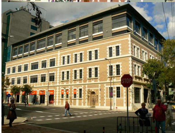
Фиг. 10-11-12. Оригиналната сграда, преди разрушаването, проектът и реализацията

И още един аргумент срещу подмяната на оригинала с бутафорни копия е нетрайността на материала, който уж трябва да възпроизведе декоративната фасадна пластика. Само за няколко години, профилираните детайли на етажните корнизи, армирани с PVC- мрежа и лепила, започват да се рушат и поставят под въпрос прилагането на този метод на формално отношение към наследството.