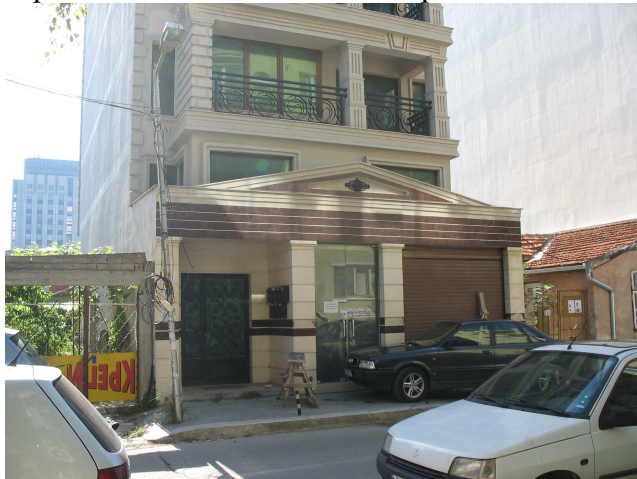
Фиг. 24. Жилищна сграда на ул. Цар Асен в строеж

Още няколко примера показват колко трайно, подобни реализации се настаняват в градския пейзаж на Варна, без връзка със съвременната архитектурна тектоника, монолитни стоманобетонни конструкции, строителни технологии и материали.