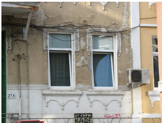
Фиг. 18. Оригиналният детайл е останал само върху несанираната част на сградата

Следствие на това, избирателно са премоделирани фрагменти от фасадната пластика, при това без да са снети точни копия от оригинала. Резултатът, виден от илюстрациите, показва ясно разликите.