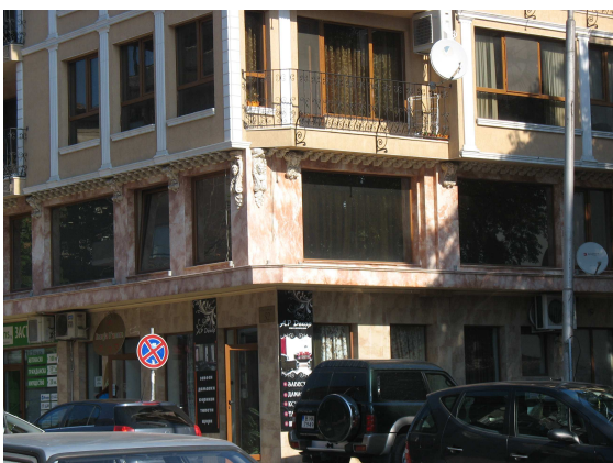
Фиг.21. Фрагмент от етажната декорация