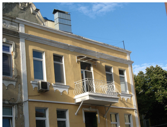
Фиг.16. Фази на обезличаване на сградата/ преди и след санирането

Последователно са премахнати и други конструктивни и декоративни елементи на паметника.