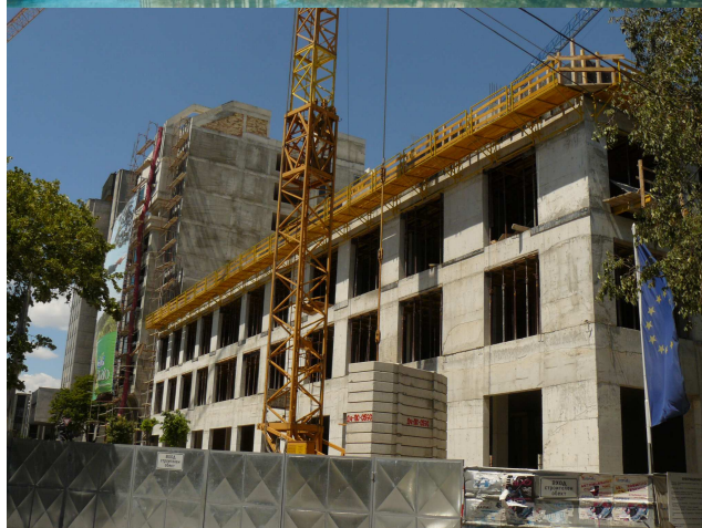
Фиг. 8-9. Нова стоманобетонна структура на мястото на съборената оригинална сграда

Приложеният принцип на декориране на нова стоманобетонна структура, по-скоро напомня сценична бутафория, отколкото оригиналната квадратна зидария от камък и светъл клинкер на паметника, характерна за неговата англосаксонска архитектура. Замяната с евтини серийни детайли от изкуствен материал (вид polyfoam), макар и по модел на оригинала, не може да бъде припознат като копие на специфичната фасадна третировка на отворите, поради разликата в текстурата на двата материала и технологията на изпълнение- апликиране на декор, а не