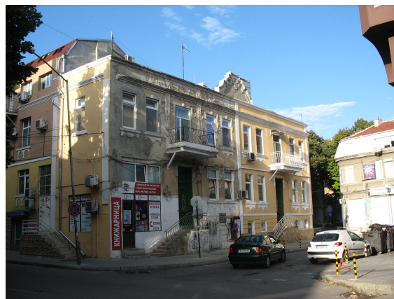
Фиг. 13. Сецесионова сграда ул. Шипка /ул. Драган Цанков 27

Отново проблемът за опазване на автентичната архитектурна памет е пренебрегнат за сметка на строително-технически подобрения със съмнително качество и материали.