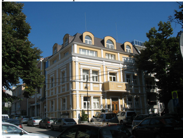
Фиг. 29. Сграда на ул. Шкорпил №