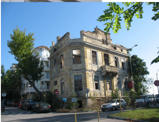
Фиг. 1- 2. Безстопанствена сграда на ъгъла на бул. Приморски /ул. Черноризец Храбър / състояние 2008 и 2014

Различат се няколко метода за подмяна на автентична архитектура с нова, по модел на оригинала.