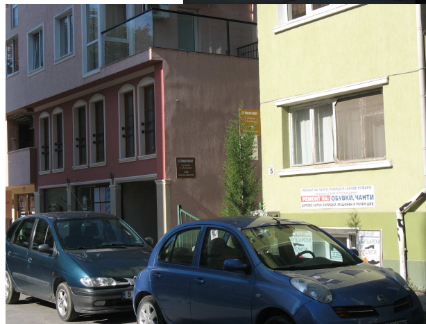
Фиг. 23. Жилищна сграда на ул. Цар Асен 3, уподобяване на оригинала в нова конструкция