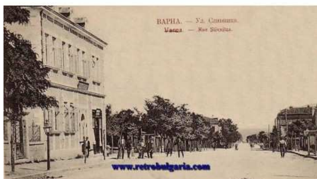
Фиг.4. Архивен изглед на колежа

Сградата е ползвана като военна болница по време на Първата световна война, а през 1922 е надстроена с трети етаж от арх. Дабко Дабков, който я разширява с пристройка по бул. Сливница през 1931 г. Само година след честване на 50-сет годишния си юбилей, колежът е закрит през 1948 г. и сградата остава неизползваема дълги години, въпреки няколкократната смяна на собствениците. Разрушена е през 2008 г., въпреки, че е паметник от местно значение.