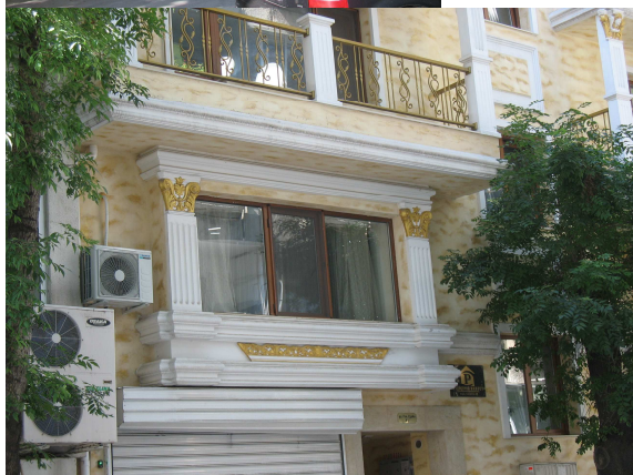
Фиг. 25-26. Нова жилищна сграда на ул. Ген. Столетов, 2013