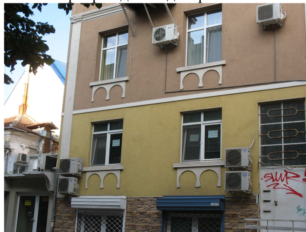
Фиг. 17. Сецесионовият детайл е заменен от произволна интерпретация

Поредното обезличаване на паметника става през последните две години, когато част от собствениците решават да санират, всеки своята част, без оглед на общата фасада и необходимостта от съответно общо решение за цялата сграда. Вместо прилагане на детайл, който да отчита богатата пластика на фасадата, е използван стандартния с монтаж на топлоизолиращите облицовки отвън, обичаен при фасади без декоративна пластика.