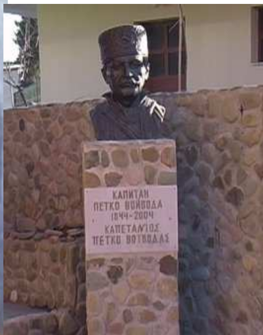
Паметникът в родното му село Доганхисар