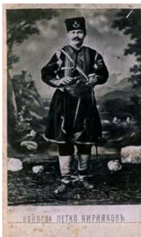
Снимка на Капитан Петко Войвода, подарена от него на Георги Бойкинов.