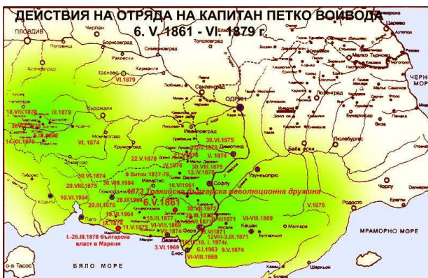
Действия на отряда на Капитан Петко