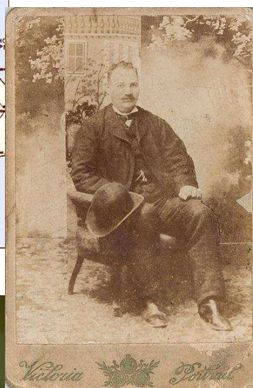
Капитан Петко Войвода