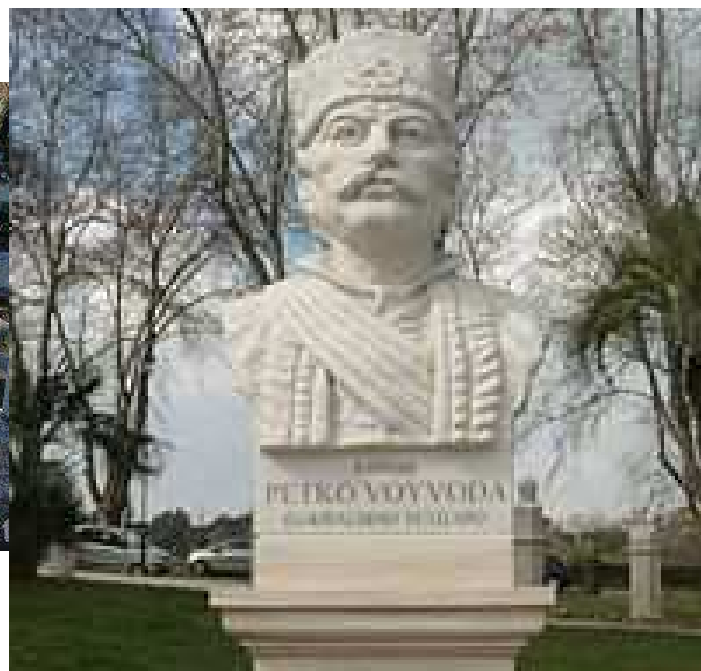
Паметник на Капитан Петко войвода в Рим