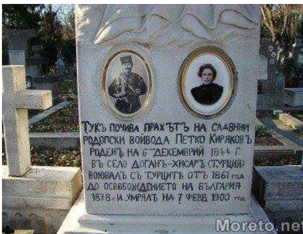
Гроба на Капитан Петко Войвода, на старите Варненски гробища