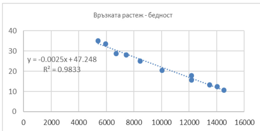
Фигура 2. Връзката икономически растеж –бедност в глобален мащаб.

Корелацията между растеж (измерен като БВП на глава от населението) и бедност (относителен дял на бедните в световното население, линия на бедност 1,9 долара на ден) е изключително висока, почти достига 1.