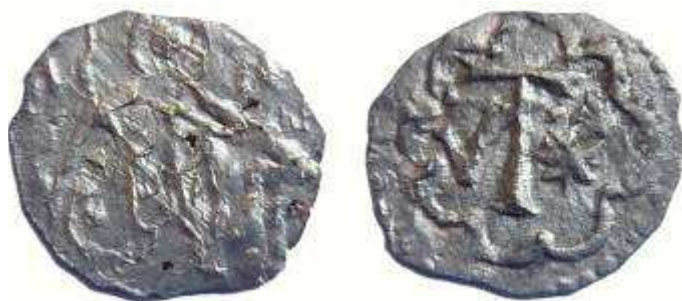
Фиг. 5. (d.14 мм; m. 0, 30г)

Неописан сребърен грош от края на XIV или средата на XVв.