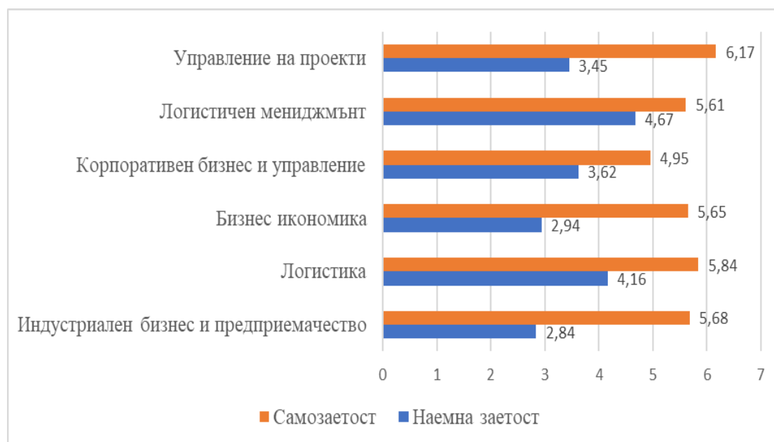
Фигура 2. Средни оценки на самозаетостта и наемната заетост като кариерни възможности по специалности